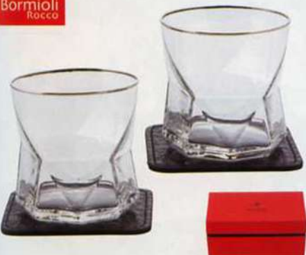
7. ボルミオリロッコ ペアオールドグラス