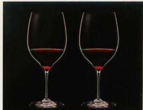
3. <グレープ@リーデル> ペア カベルネ/メルロ

申込番号 127-528 (2414/22-2) ●現品約8φ×10.5cm・ハコ約9.6×14.2×20cm・重量=約660g●クリスタルガラス(無鉛)●容量=約375ml●木箱入●ドイツ製(☎A5) ●SZZ ●691610900