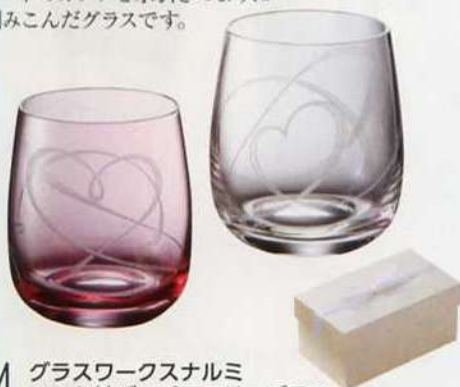
4. グラスワークスナルミ ペア ハート結び ペアフリーグラス