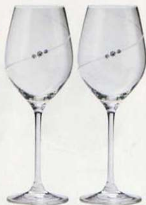
6. ロナ シルエット ペアワイングラス