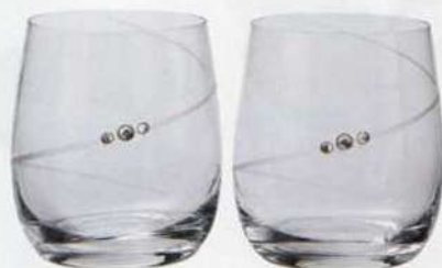
5. ロナ シルエット ペアグラス