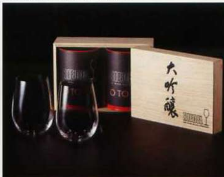
2. <リーデル・オー> ペア 大吟醸オー 酒テイスター (木箱入)

申込番号 127-510 (414/11) ●現品約6.2φ×15cm・ハコ約13×6.5×15.5cm・重量=約250g●クリスタルガラス(無鉛)●容量=約245ml●ドイツ製(☎A5) ●SZZ ●870320860