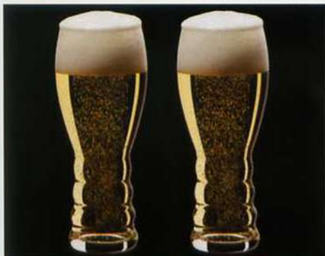
1. <リーデル・オー> ペア オー・ビア

創業260年以上の歴史を誇るワイングラスの老舗、リーデル。 同じワインでも異なる形状のグラスで飲むと香りや味わいが変わるという事実に着目し、 ブドウ品種ごとに異なる形状を開発。 ワイン生産者や愛好家の方々から大きな信頼が寄せられています。